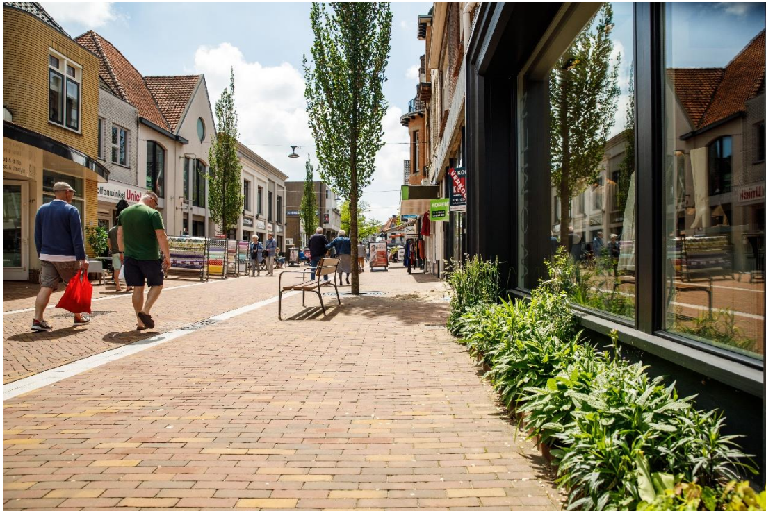
Impressie van de Grotestraat in Ede, een van de straten die in het onderzoeksproject werd onderzocht en waar de gemeente met eigenaren inzet op vergroening.