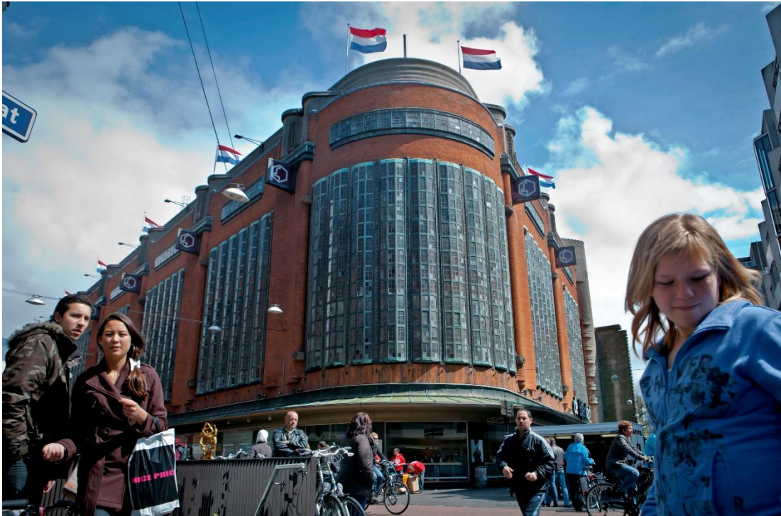
Straatbeeld in de Grote Marktstraat in Den Haag, een van de deelnemende straten in het onderzoeksproject.