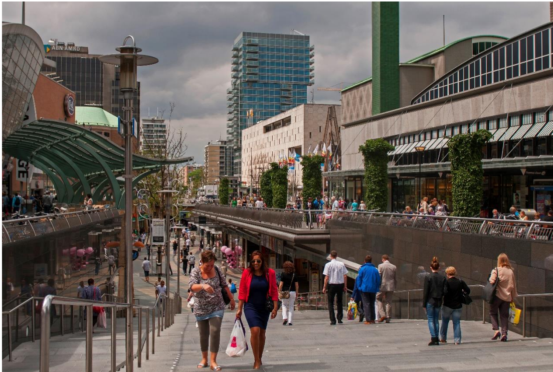
De Koopgoot in Rotterdam, een van de deelnemende straten in het onderzoeksproject.