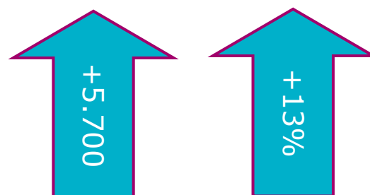
Fig. 2: Ontwikkeling leisure in Nederland, 2004–2014